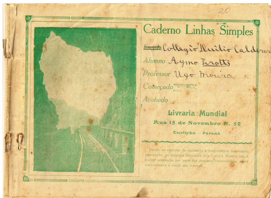
Figura 3 – Capa do Caderno Linhas Simples 11

Ainda na capa é apresentada a imagem da linha férrea e a saída de um túnel que representa a ligação do planalto com o litoral. Segundo Mignot (2008), as ilustrações apresentadas nos cadernos procuravam disseminar lições que enfatizavam o patriotismo que se procurava inculcar no espaço escolar; “os cadernos eram objetos através dos quais se deveriam transmitir ensinamentos e valores a serem perpetuados” (Mignot, 2008, p. 72). A linha férrea era sinônimo de modernidade paranaense, referência por sua engenharia ousada e de grande importância econômica visto que proporcionava maior facilidade de comunicação do porto de Paranaguá com o interior do estado do Paraná.