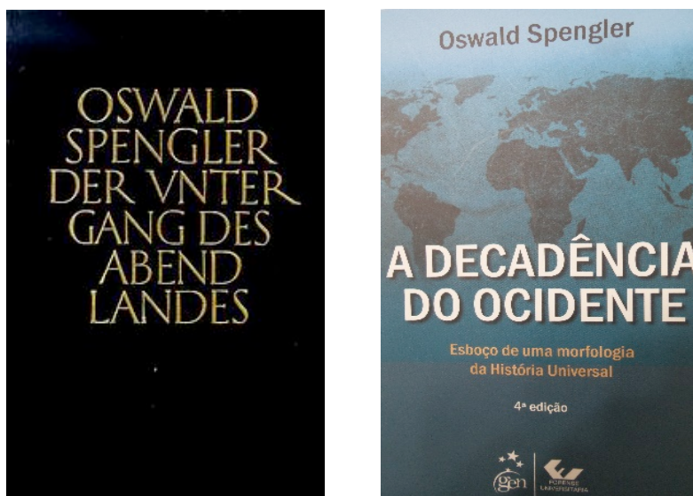
Imagem 4 – Capas das edições alemã e brasileira da obra de Oswald Spengler