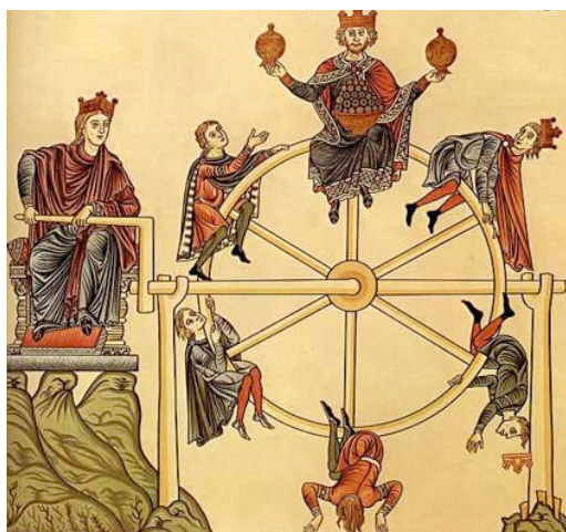
Imagem 6 – La Roue de la Fortune