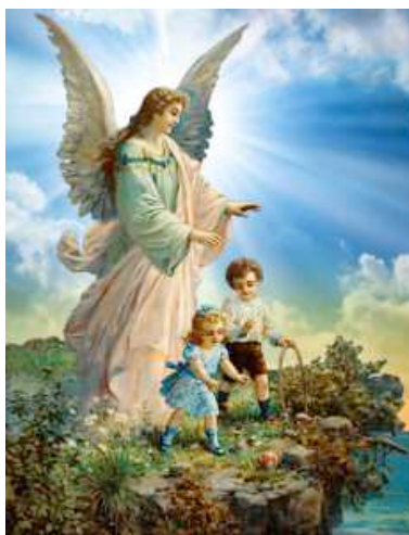
Imagem 3 – Um anjo da guarda nos protegendo do abismo