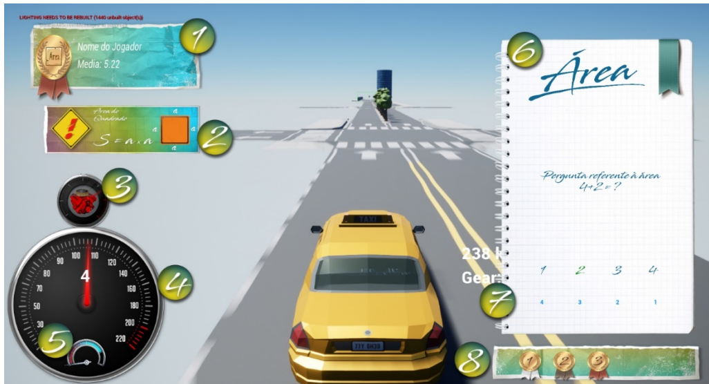
Figura 3: Imagem da corrida do jogo GearMath