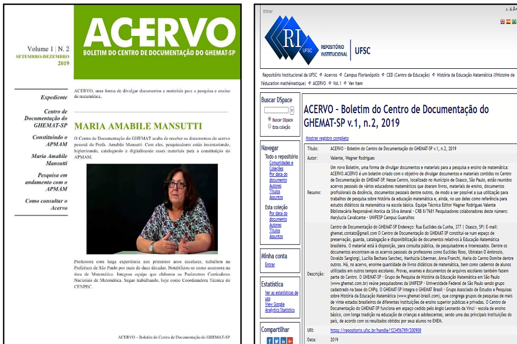
Figura 1 – Acervo Pessoal Maria Amabile Mansutti – APMAM.

Fonte: Acervo – Boletim do Centro de Documentação do GHEMAP-SP, 2019.