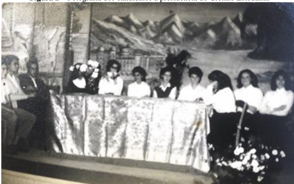
Figura 2 – Fotografia dos candidatos à presidência do Grêmio Estudantil