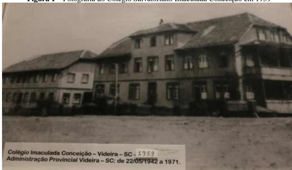
Figura 1 – Fotografia do Colégio Salvatoriano Imaculada Conceição em 1939