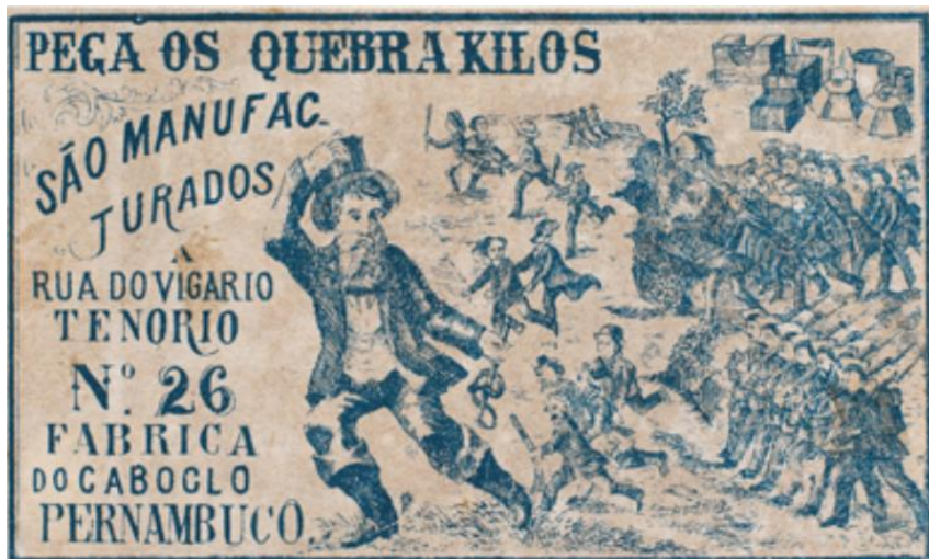
Figura 1 – Rótulo de cigarro fazendo referência aos Quebra-quilos (Recife, PE)